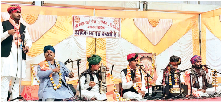
हरिभूमि न्यूज सिरोंज

शहर के प्रसिद्ध महामाई मंदिर में प्रतिवर्ष की तरह इस वर्ष भी आयोजित होने वाले भव्य मेले का शुभारंभ होते ही पूरे परिसर में भक्ति और उत्साह का माहौल देखने को मिल रहा है। मंदिर परिसर में सुबह से लेकर देर रात