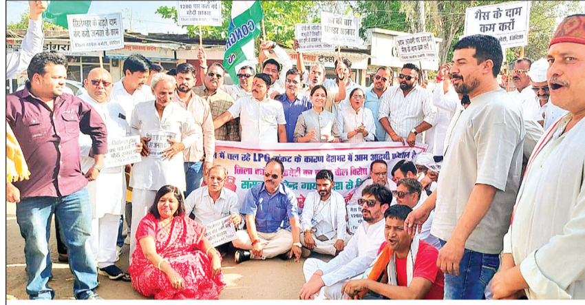
विदिशा। नगरपालिका के सामने सड़क पर बैठकर प्रदर्शन करते हुए कांग्रेसी पदाधिकारी व कार्यकर्ता।

विदिशा नगरीय निकाय को शासन से डबल-प्लस श्रेणी का दर्जा प्राप्त है और हर वर्ष करोड़ों का बजट खर्च किया जाता है, इसके बावजूद शहर की स्थिति बदहाल बनी हुई है। जिसके विरोध में सोमवार को कांग्रेसियों ने जमकर प्रदर्शन किया।