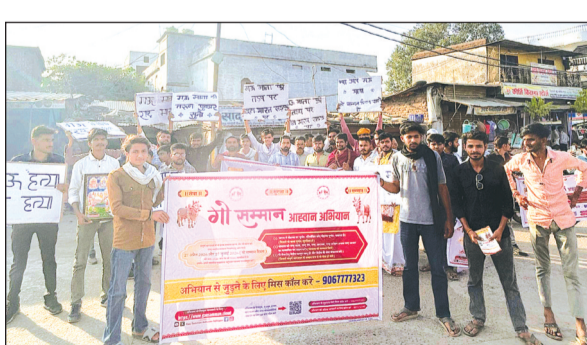
हरिभूमि न्यूज बरेली

गौमाता को राष्ट्रमाता का सम्मान सेवा सुरक्षा, गौ हत्या पर पूर्ण प्रतिबंध जैसी मांगों के लिए चार तहसीलों बाड़ी, बरेली, खरगोन, बम्होरी, सिलवानी, उदयपुराके गौ भक्तों द्वारा बाड़ी स्थित मां हिंगलाज मंदिर से गौ माता की पूजन कर गौ सम्मान आवाहन अभियान यात्रा रैली प्रारंभ हुई। जिसका समापन नर्मदा तट बौरास में हुआ। गौमाता की सुरक्षा सम्मान और गौ हत्या पूर्णतः बंद करने जैसी मांगों से सम्बंधित नारे लगाते हुए वाईक